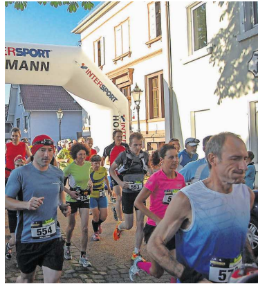
Der Start des Nachmarathons ist in Mutschelbach.

Nachmarathon. In diesem Monat ist es wieder so weit: beim großen Laufwochenende geht auch der 6. Nachmarathon auf die Strecke. Er ist einer von nur drei Veranstaltungen dieser Art in ganz Deutschland.