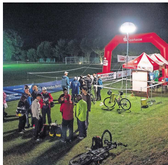
Die Zielankunft findet dann bei absoluter Dunkelheit statt.