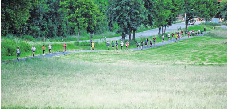
In der Gruppe stärker: der 4 x 20 Km-Etappenlauf.