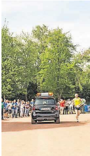
Die Ansicht, die die Spitzenläufer während des Laufs vor sich haben werden.

Mobil. 80 „mörderische“ Kilometer auf einem Rundkurs, der von Karlsruhe-Rüppurr über Durlach und acht weitere Schwarzwald-Orte via Ettlingen wieder zum Startpunkt zurückführt – das ist der „Fidelitas-Nachtlauf“, der in diesem Jahr vom 20. auf den 21. Juni ausgetragen wird. Ein Kraftakt nicht nur für die rund 800 Teilnehmer, auch für den Logistikpartner „S&G Automobil AG“. Sponsor des Events, ist der Nachtlauf eine ganz besondere Herausforderung.