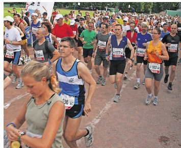
Gestartet wird gemeinsam mit dem „37. Internationalen Fidelitas Nachtlauf“.