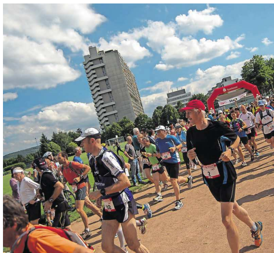
20. Juni: Der Tag, auf dem so viele hin trainiert haben.