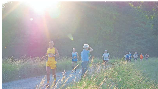
Bis in die Nachtstunden wird gelaufen hoffentlich vor zahlreichen Publikum.

Wichtige Informationen für die Bevölkerung: