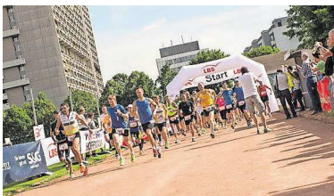
Los geht's: Hunderte Läufer begeben sich auf die 80 Kilometer lange Strecke.

Höhen und Tiefen bietet die bewährte Routenführung: Start ist beim FC Südstern, danach bleibt es zunächst flach. Nach dem Oberwald gibt es zunächst etwas Industriecharme im Killisdorf. Weiter geht's nach Hagsfeld und Grötzingen, dann dominiert die Farbe Grün in der freien Natur. Und es geht außerdem aufwärts: Knapp 20 Kilometer haben die Läufer schon absolviert, dann geht's von der Rheinebene hinauf bis auf 370 Höhenmeter. Sollte das Wetter sommerlich heiß sein, wartet während des beschwerlichen Aufstiegs eine der größten Herausforderungen auf die Läufer: Es geht vorbei am Freibad Singen. Während dort noch die Wasserratten plätschern, müssen die Läufer aber durchhalten - sie haben noch einen weiten Weg vor sich. Abkühlung gibt es nur an den zahlreichen Versorgungsstationen, die entlang der Strecke unter ande-