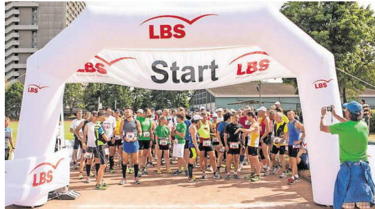
Da ist es noch hell: Der Start auf dem Gelände des FC Südtern findet am 20. Juni um 17 Uhr statt.

80 Kilometer beim 37. „Fidelitas Nachtlauf“